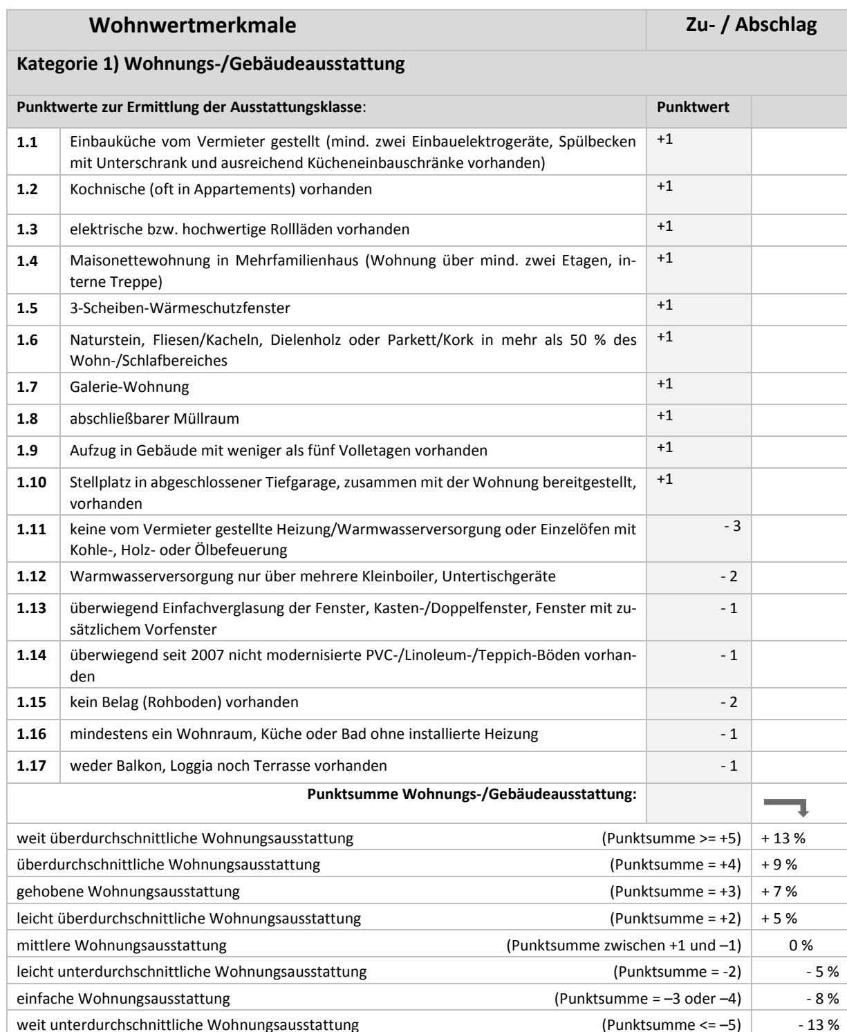
Tabelle 2: Weitere Wohnwertmerkmale, die den Mietpreis signifikant beeinflussen